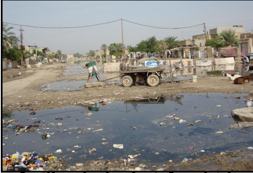
الم المبحث ال التلوث البي ١-٢ : فح

تقوم دوائر الصحة في محافظة ديالى بالقيام بعملية فحص عينات من الشبكة المنتجة في مشاريع الانتاج وبعد ضخه الى الشبكة . تقوم الدوائر الثلاث بسحب عينات من الشبكة من مختلف احياء المدينة واجراء الفحص عليها لغرض التأكد من وجود تلوث من عدمه وتنسق هذه الدوائر عملها فيما بينها .